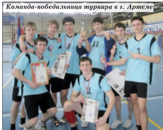
Команда-победительница турнира в г. Артеме