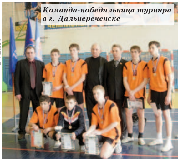
Команда-победительница турнира в г. Дальнереченске