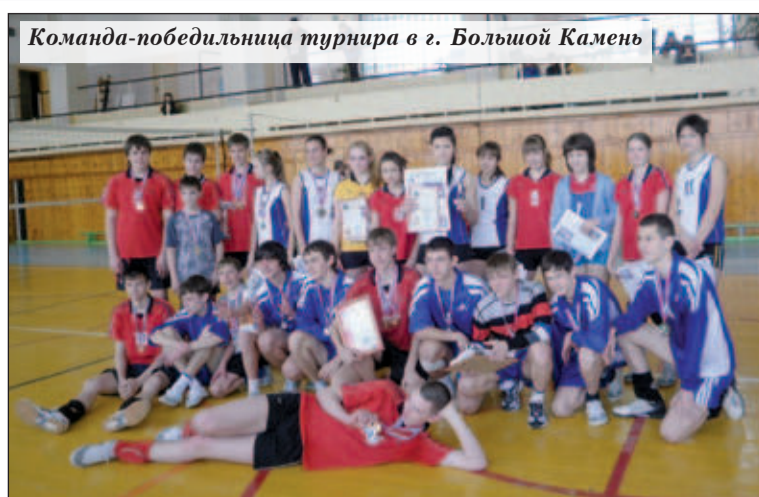
Команда-победительница турнира в г. Большой Камень